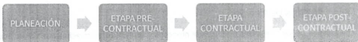
Figura 1. Etapas de la Gestión de compras y Suministro

Etapas Post-Contractual: Empieza con la terminación de la prestación del servicio contratado o suministro del bien hasta la liquidación del contrato, es decir el cierre del contrato. Incluye la evaluación de desempeño del proveedor.