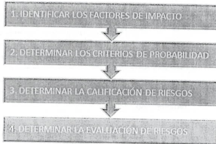
Figura 3. Pasos para el Análisis de riesgos