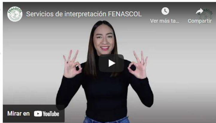
Ilustración 1 Servicios de interpretación FENASCOL

En https://www.emcali.com.co/atencion-y-servicio-a-la-ciudadania/puntos-de-atencion-fisicos se publica los puntos que cuentan con este servicio.